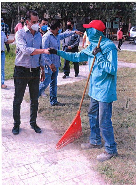
El programa representa una excelente oportunidad para la gente.

Para todos los interesados en formar parte de estas cuadrillas de trabajo favor de comunicarse al teléfono: 8134-23-8490 donde una operadora les tomará algunos datos y llevará a cabo una pequeña entrevista. E