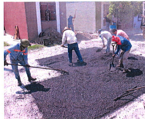
Se ha bacheado una gran cantidad de metros cuadrados, y sigue el programa.